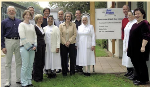
Team der Hahnemann Klinik

Ziel der zweiten Expertenkonferenz soll es sein, die in der Zwischenzeit gesammelten Erfahrungen auszutauschen und zu ergänzen, um uns so bei der täglichen Arbeit den Mut und das Wissen zu geben auch in diesen schweren Krebsfällen helfen zu können.